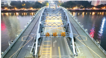
■11月11日18时，平常本应该是下班人流和车流高峰的海珠桥，因为实施围蔽变得异常地冷清。