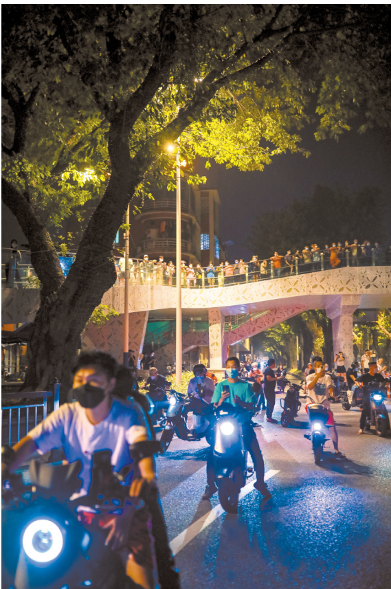
■11月13日23时10分，距离通告公布的封闭结束时间还有50分钟，海珠桥南入口处已经开始有市民聚集等待解封。