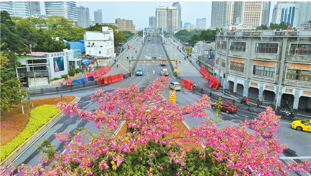
■11月14日8时34分，海珠桥在交通管控之后重新开放，桥面上行人和车辆双向通行顺畅。