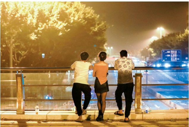
■11月14日凌晨1时20分左右，在海珠区海印桥南入口处的人行天桥上，几名市民在静静地看远处的海印桥。