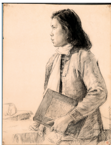
■杨之光素描示范,1962年