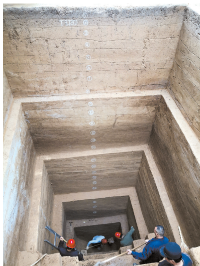
■殷墟小屯宫殿宗庙区池苑遗址解剖发掘情况(资料照片)。新华社发