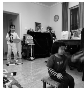
■西酉(后)作为家里的大姐姐,在照顾妹妹过程中获得满足感。

“老师说吃饭要多一些营养搭配,所以我也爱上了下厨房,跟阿妈学会了炒番茄、蒸蛋,这是妹妹最爱的菜。”小女孩笑着说,看到妹妹吃得津津有味,自己很是兴奋,“把妹妹教得听我话、喜欢我,我觉得做姐姐的感觉真好。”