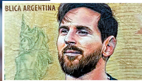
■网友为梅西设计多款大额货币。