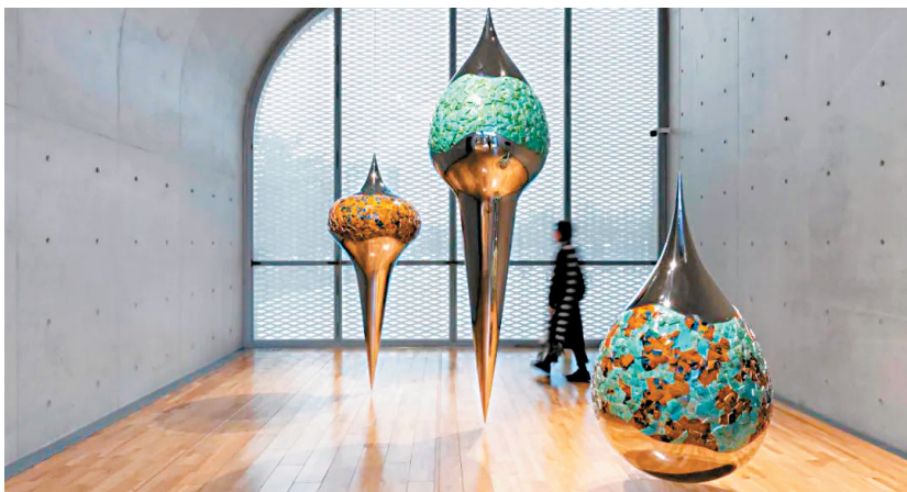
“和合共生——李鸿伟的艺术”日前在上海龙美术馆举办。