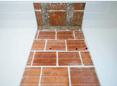
■在二楼屋顶及隔墙局部展示的创新屋面结构及空心砖。

林克明旧居是纪念林克明先生和了解广州近代生活的重要媒介,其活化利用有助于推动社区复兴。期望林克明旧居陈列馆成为东濠涌、北园酒家、越秀山、中山纪念堂这一历史文化游径上的一个节点,提升旅游价值。