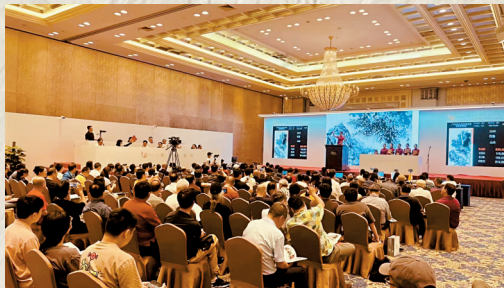
■“广东崇正2023年春季拍卖会杨之光艺术教育基金会慈善专场”现场