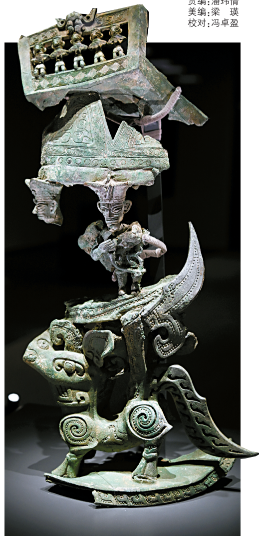
■青铜神坛(残件)。