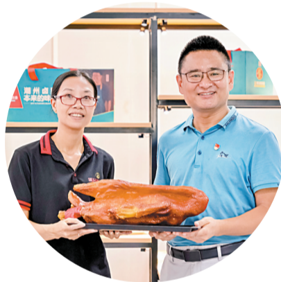
■工作队走访磷溪镇溪口卤鹅龙头企业尚顶香食品公司。