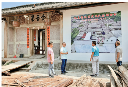
■仙美村的金吾第正在修缮,将打造成红色景点。