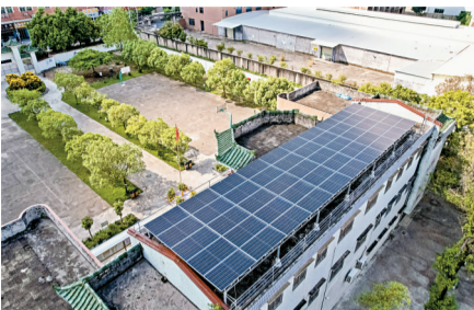
■凤美村的光伏项目建在凤美小学楼顶。