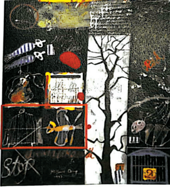
■被诉侵权画作Y12(红色框线内为原告主张相似的部分)