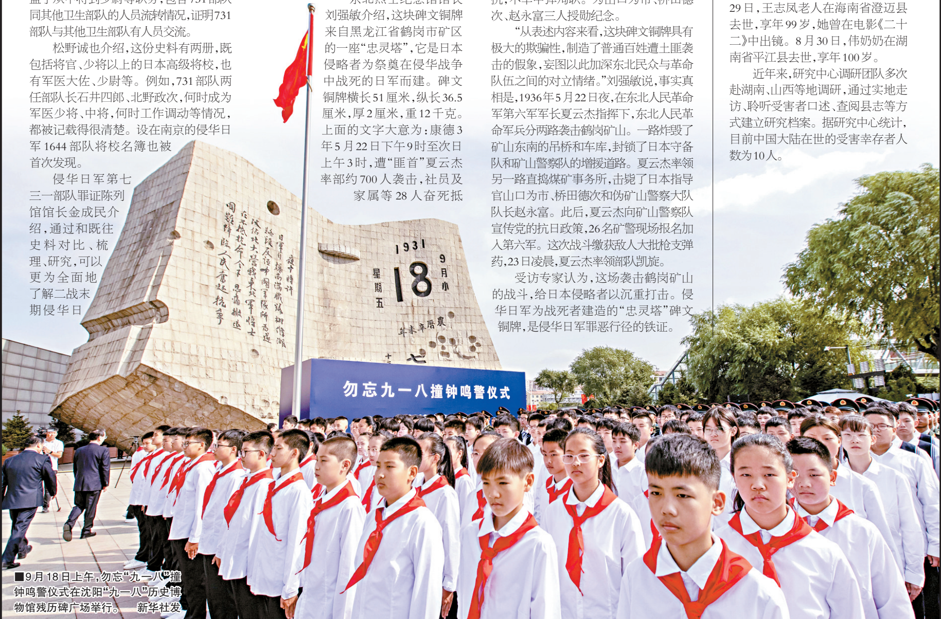
■9月18日上午,勿忘“九一八”撞钟鸣警仪式在沈阳“九一八”历史博物馆残历碑广场举行。

近年来,研究中心调研团队多次赴湖南、山西等地调研,通过实地走访、聆听受害者口述、查阅县志等方式建立研究档案。据研究中心统计,目前中国大陆在世的受害幸存者人数为10人。