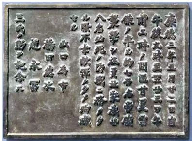
■东北烈士纪念馆展出的侵华日军为战死者建造的“忠灵塔”碑文铜牌。