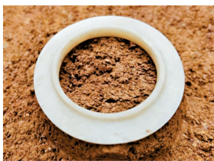
■西周时期T形玉环,2021年黄埔榄园岭遗址出土