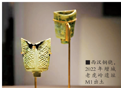
■西汉铜镜,2022年增城老虎岭遗址M1出土

展览从2022年广州18宗考古发掘项目的新成果中精选陶器、铜器、铁器、银器、水晶、贝壳等各类出土文物约260件/套进行展示,分为居住、劳作、埋葬三部分。从化狮象、黄埔竹园岭、南沙合成等一批重要史前先秦遗址,为重构广州建城以前珠江三角洲人类历史提供了重要资料。市第一人民医院、荔湾鹤洞、广州动物园、增城沙溪村等项目发现的历史时期遗址和墓葬对探索广州城市发展轨迹意义重大。其中,广州市第一人民医院改扩建项目工地南越国至清代遗址还入选“2022年度广东省重要考古发现”。