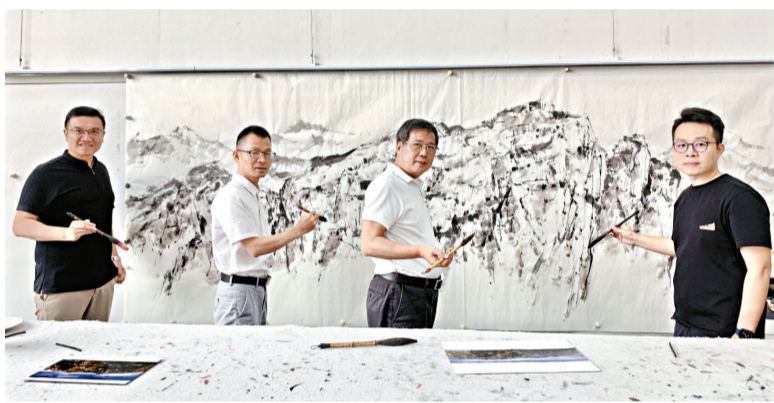
■四位画家在合作创作。