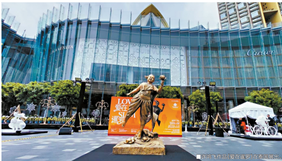
■许鸿飞作品《爱在暹罗》在泰国展出。