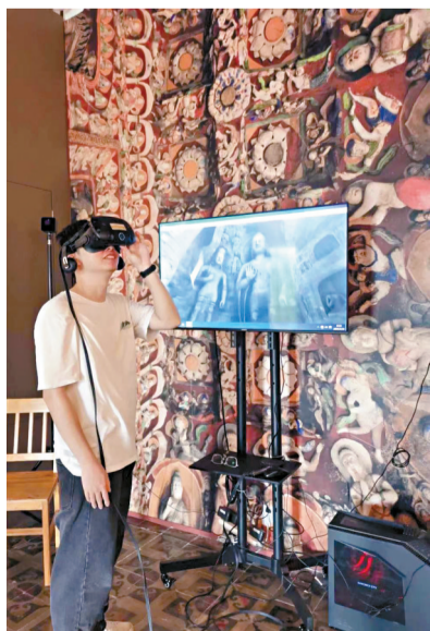
■展览现场特别设计了VR互动等环节。