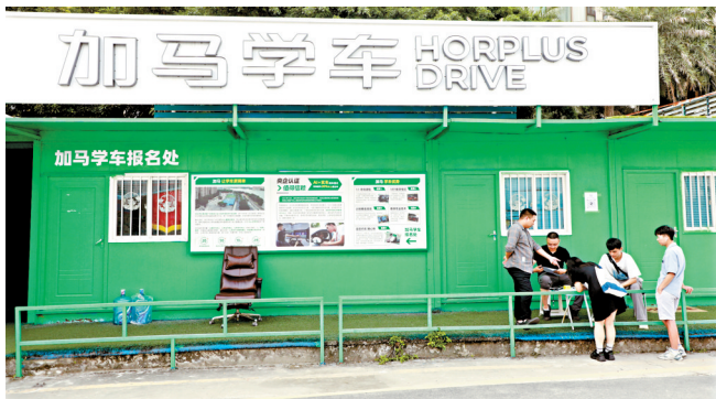
■在加马驾校广州塔训练场,工作人员正在登记学员信息。

成本价收取费用:未注册学籍阶段收取450元学籍费用;已注册未考科目一、四阶段可自行通过App远程培训,完成科目一、四学时,并且通过“交管12123”预约考试。科目二、三阶段按900元、500元的标准收取后续培训费用,科目二和科目三一次性缴纳培训按照1200元收取,上述费用已含除考试和补考费用外的所有培训和服务费用,需学员先行垫付,公司将按上述标准开具相应的培训费用欠款单给学员;学员原报名班型已包含各科目初考费480元及驾驶证工本费10元,同样需请学员先行垫付,公司将一并开具欠款单给学员。学员垫付的费用,后续待公司运营恢复正常,财务状况好转后,学员可凭欠款单,由该公司陆续退还相应费用。