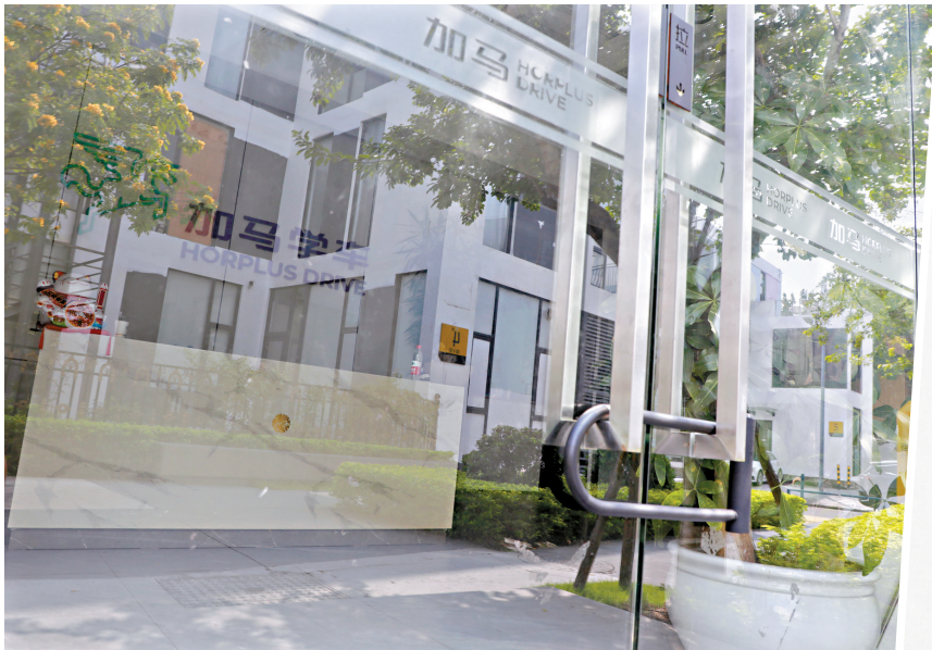
■加马驾校公司总部大门紧锁。