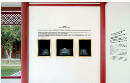
■ 展览以卡地亚典藏为序章。