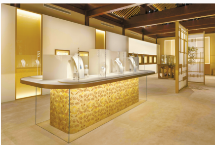
■ 世界之美主题展区。

卡地亚全新高级珠宝展日前在北京郡王府揭开帷幕,包括全新系列在内的380余件高级珠宝、高级制表、高级珠宝腕表和卡地亚古董珍藏作品,悉数汇集京城,以崭新的视角回溯风格本质。