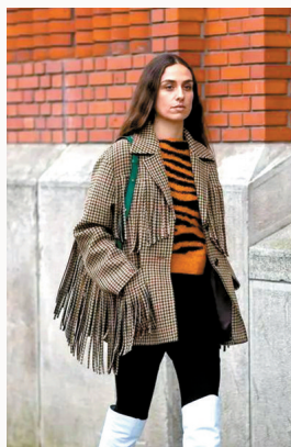
▲ 流苏与西装或衬衫结合一般是点缀在衣袖和胸前,注意这些位置要繁简结合。