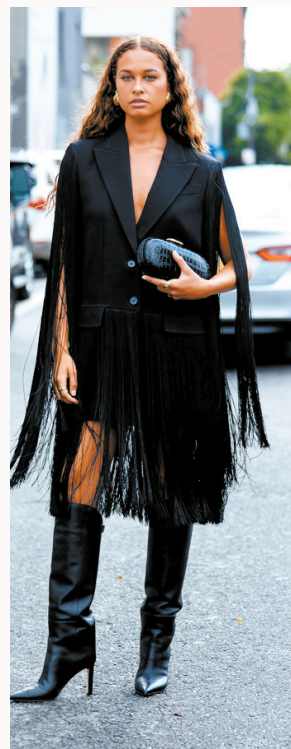
▲ 流苏以解构而非叠加方式出现在像西装这样线条硬朗利落的单品上时更能发挥灵动魅力。