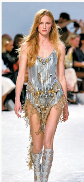
■ Rabanne 2024春夏系列

Rabanne 在巴黎时装周推出的春夏系列以刺绣和流苏与金属元素碰撞,呈现奢华而富异国情调的视觉。