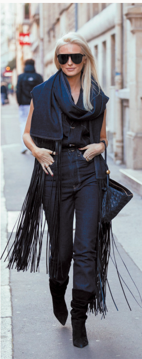
▲ 今年流行的裙裤搭配,可用流苏裙或长流苏上衣来呈现,别具时髦感。