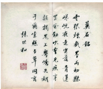
■英石铭《十竹斋画谱》。图片来自范白编著《英石志林》。

讨英石一些玩法。有一年他给我写了一副联:“唯尊石道,彼论他言”却一直影响着我在玩石的路上。