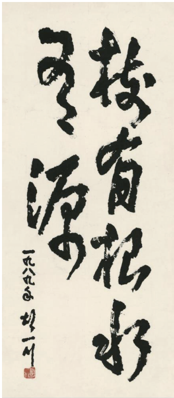
■树有根水有源 1989年 广州

胡一川日记,作为现代美术史乃至现代革命史的重要史料,其最重要的价值之一,是让后世的读者可以更深入理解社会变革与现代艺术家个体之间的复杂关系。蔡涛认为,“我尤其体会到,胡一川长达半个多世纪的日记书写和他的革命志业、艺术实践互相交织,形成了一个多功能、多文体的话语综合体。”