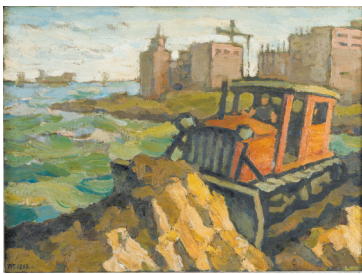
■特区建设一角 1983年 广州 布纹纸油画