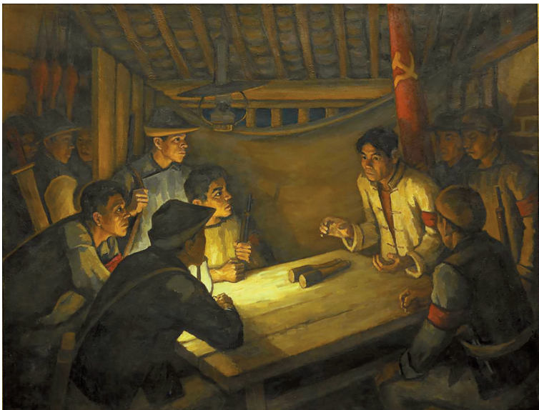
■前夜 1961年 广州 布面油画中国美术馆藏

由广州美术学院主编、广西师范大学出版社出版的《胡一川日记》影印本全集,是近年备受瞩目的二十世纪艺术大家的文献出版项目,更是胡一川最重要的研究出版物之一。本次启动仪式以“人生前线”为题,可谓一语双关,胡一川作品《到前线去》成为唯一入选美国一本通用高等美术教材的中国艺术家的作品,同时,“‘到前线去’,是他人生鲜明的写照,面对民族的危难,他总是坚毅地、迅速地把视野投向时代的前线,用艺术创作作为人们带去热血和希望,为奋起抗争的国家发出强有力的呐喊。”广州美术学院党委书记谢昌晶在活动现场回忆表示,早在他调任广美工作没多久,他就跟学校党委建议,“一定要把到胡一川故居学习,作为新生入学教育的必修课之一。”