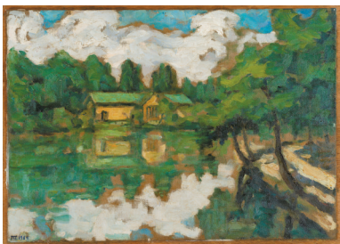
■贵州花溪 1984年 贵州 布纹纸油画