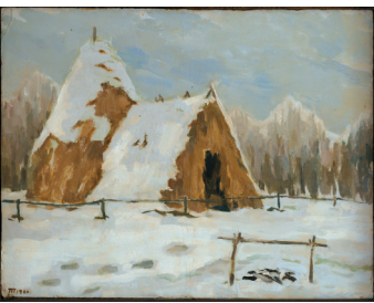
■列宁住过的草棚 1960年