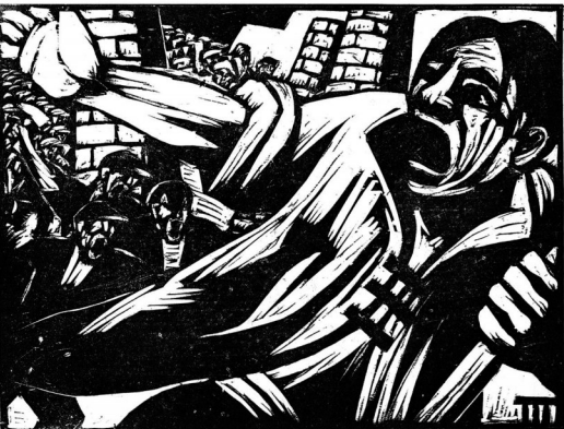
■到前线去 1932年 上海