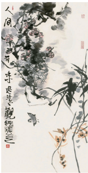
■方土 人间有味是清欢 2016年