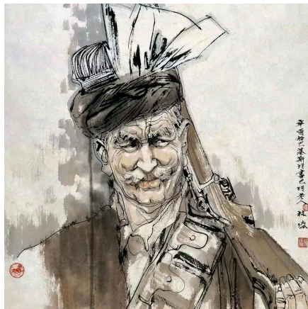
■林塘 巴基斯坦老兵 1981年