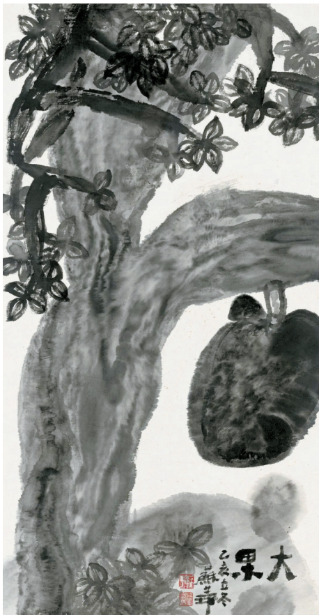
■苏华 大果 2019年

许晓生介绍,岭南地区作为改革开放的前沿阵地,始终勇立潮头,以最为开放的心态锐意求新。江门市是广府文化的代表城市之一,也是新时代粤港澳大湾区建设中的重要组成部分,这一次以“时代新语·开放视野”为学术主题的系列展览活动在江门举行,旨在以江门为基点,充分发挥艺术赋能城市发展的效用,助力增强粤港澳大湾区文化软实力,推动粤港澳大湾区美术事业实现高质量发展。