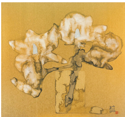
■林蓝 喜悦 2019年