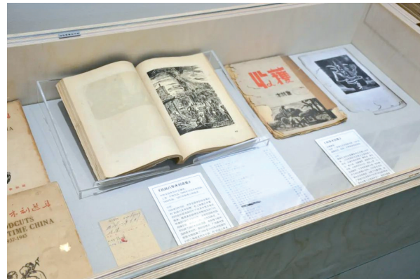
■“美育先声——广州美术学院建校七十周年图书文献特展”现场。