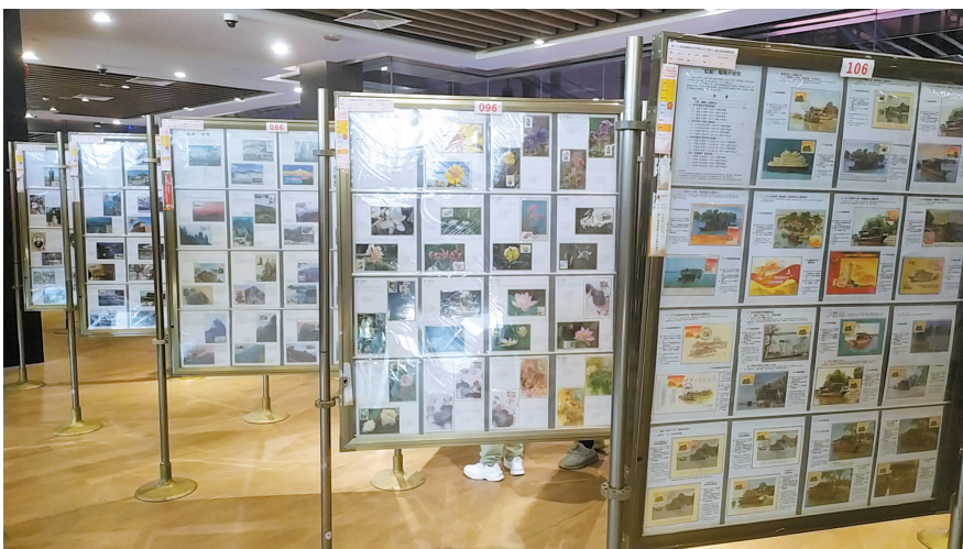
■第二十三届羊城集邮文化节暨第十二届全国极限集邮展览现场。