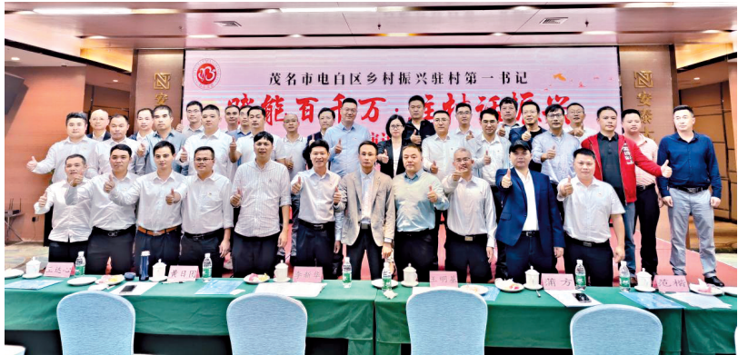
■参赛的茂名电白区驻村第一书记合影。

新快报讯 记者朱清海报道 “没有等来的精彩，只有拼来的辉煌……” 11月29日，茂名市电白区乡村振兴驻村第一书记“赋能百千万 驻村话振兴”演讲比赛顺利举行，来自电白区19个镇街的35名驻村第一书记同台演讲，讲好乡村振兴精彩故事。活动由中共茂名市电白区委组织部、电白区乡村振兴局、珠海市对口茂名市乡村振兴驻电白区帮扶工作组主办。