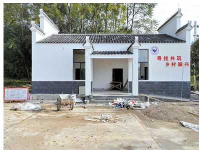
■新建的秀水村公共卫生间。

三旧改造和三清三拆等村容村貌提升工程，有效打造生态宜居、乡风文明、文化旅游的美好居所，直接带动整村群众受益，辐射影响一片，带给群众粤桂协作惠民实效，切实提高人民群众获得感和幸福感。