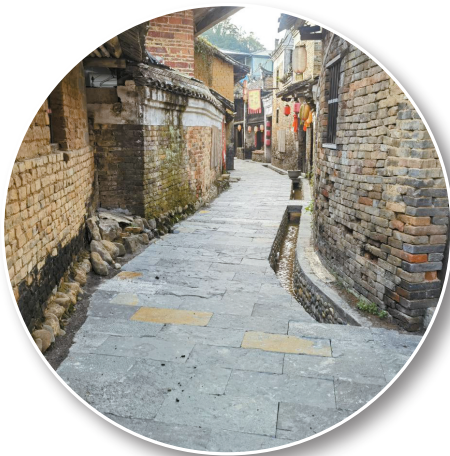
■秀水村内步道复古修饰工程升级完工。

新快报讯 记者曾贵真 通讯员胡建良报道 “天然历史博物馆”“文魁之乡”……人杰地灵的广西贺州市富川县朝东镇秀水村，正在加快蜕变成一个宜居、宜游、宜业的新秀水。按照2023年粤桂协作工作统筹安排，广东肇庆四会、广西贺州富川两地党委、政府主要负责同志已两次召开交流结对工作联席会议，商定秀水村为2023乡村振兴示范项目建设点，通过粤桂协作，为秀水村高质量打下了坚实基础。