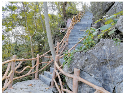
■秀水村修建的登山步道和护栏。

据统计，2021年至今，粤桂协作两地共安排了2262万元广东财政帮扶资金在富川县打造了古城、莲山、麦岭、朝东等5个乡村振兴示范点，所有资金全部用于基础设施等硬件修建，兼顾开展