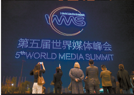
■12月2日，广州南沙举行无人机表演迎接世界媒体峰会。