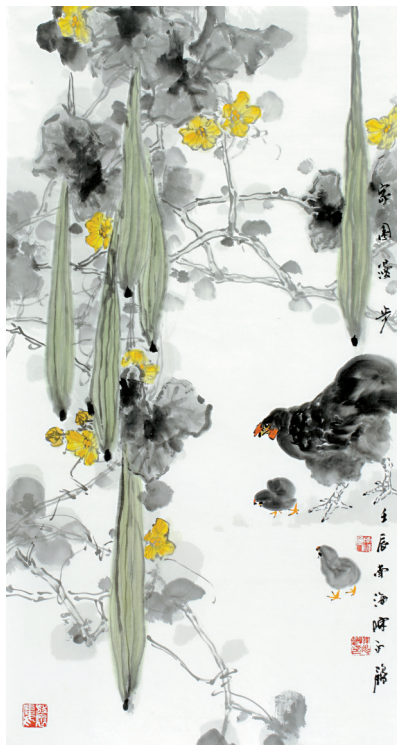
■陈永锵 家园漫步 国画 69cm×138cm

朱光荣: 纵观全展,有几位年轻人的作品给我留下深刻印象。潘小明推荐的惠州籍28岁艺术家苏黎娜的工笔花鸟,十分新颖极为成熟,可能和她长期在北京游学有很大的关系,将来成就不可限量。林蓝推荐的周文瑶画的工笔人物,细腻精致充盈诗意,让人感觉好像又一个如玉珏般的才女闪亮登场了。宋陆京推荐的申畅山水,气势逼人而又丰富耐看,得到方楚雄老师的表扬。方土推荐的黄银燕的工笔花鸟,敢把蛇画进画面里,气氛营造梦幻迷离而美感饶人。孔繁乐推荐的陈灼恺写意山水,令我眼前一亮,几幅海南写生构成一幅作品,笔墨掌控妙到巅毫。宋光智推荐的乔路遥版画,视角新颖现代而让人深思。我推荐的钟伟杰早已是省展拿奖专业户,个人面目强烈,虚幻与现实合而为一。这几位年轻人想法与众不同而又才华横溢,非常看好他们以后成为岭南画坛的中坚力量。希望以后有了这个展示年轻人才华的大舞台,能激励年轻人从中相互学习,你追我赶,通过不懈奋斗,最终成就他们的艺术梦想,顺利到达成功的彼岸!