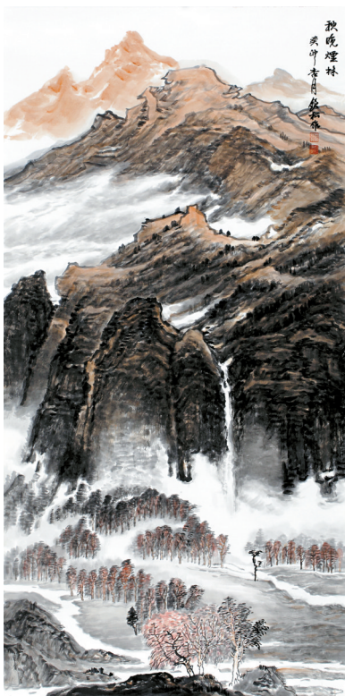
■许钦松 秋晚烟林 国画 136cm×70cm

朱光荣: 除了雕塑与水粉画,其他的画种在这次展览中都涵盖了,49位年轻画家都拿出了力作参展。名家们眼光都很锐利,年轻艺术家基本展现了他们各自与众不同的艺术追求。既有精心绘制的工笔,也有凝练概括的写意,还有繁复多样的各画种展现,都体现了