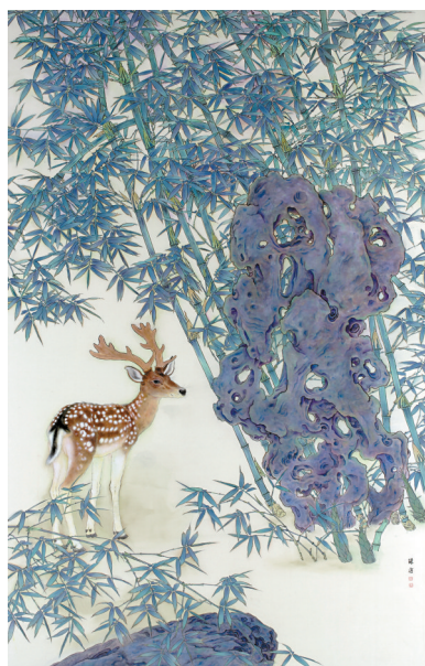
■薛康 丘园自适 国画 192cm×121.5cm