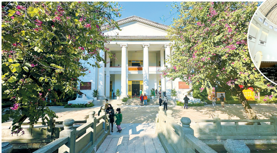
▲广东咨议局旧址中庭。

建筑本身已是历史的一部分,而位于其中的主体陈列“红色广州 英雄城市——广州革命历史陈列”,则以六个展览单元,全景式呈现了广州百年革命历史的波澜壮阔。