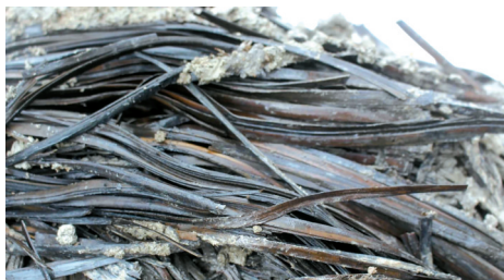
■M1093头龕內出土竹簡保存狀況。湖北省荆州市秦家咀墓地