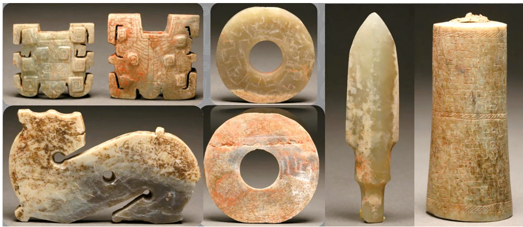
■玉质车马器及饰件。陕西省宝鸡市下站遗址

渡头古城遗址是汉代至六朝时期的“临武”县治所在地,考古发现古城址(衙署区)、居址区、手工业遗址、墓地,衙署区水井出土三国时期吴国简牍近1万枚,内容涉及临武县行政区划、赋税、户籍、屯田、矿冶等,为研究古代中央政权对南岭地区的开发和有效治理提供了重要资料。