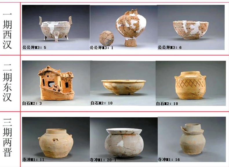
■出土陶器。湖南省郴州市渡头古城遗址