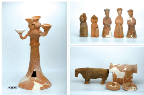
■M390出土陶俑。陕西省西咸新区北城村墓地