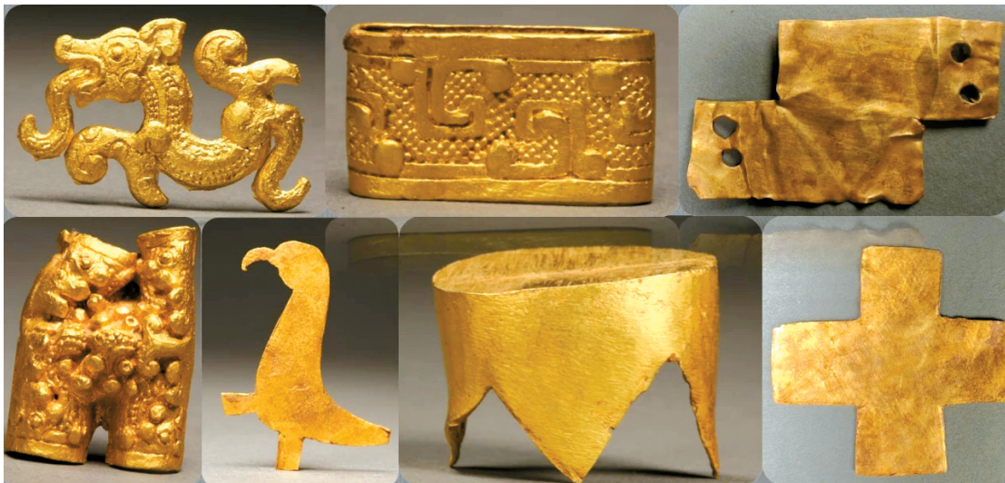
■金质车马器及饰件。陕西省宝鸡市下站遗址