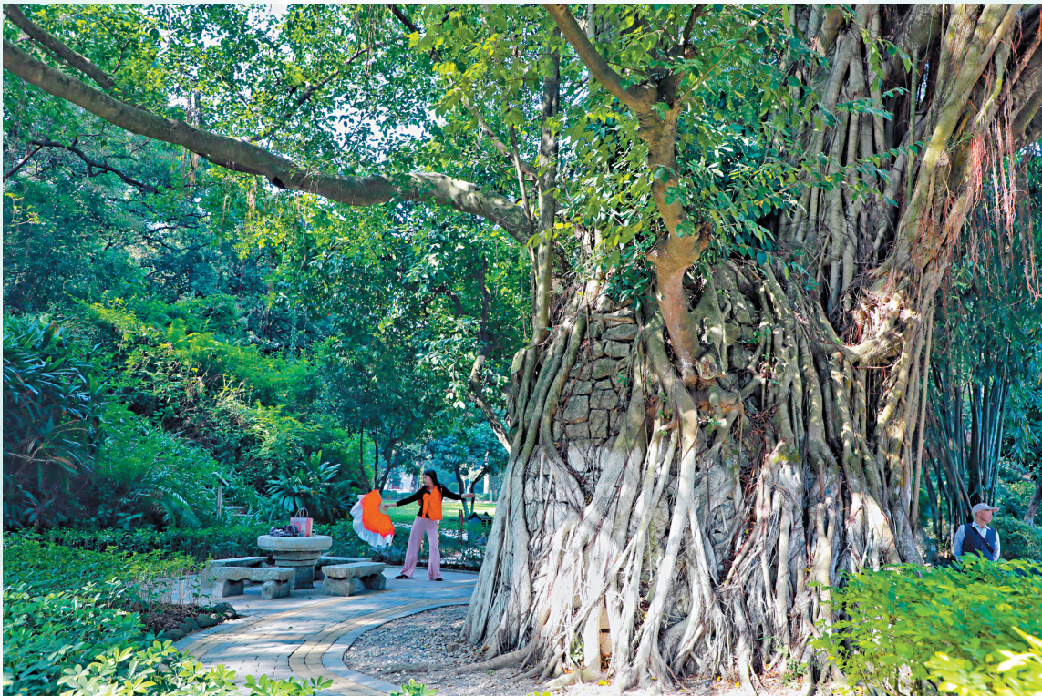
■园中名木——磐石飞榕。

珠海唐家湾,东临珠江口。江海之风,拂至北部鹤峰山麓,化作共乐园中,数百棵古树上,深绿叶片的长年温柔婆娑声。 共乐园,原为近代名人唐绍仪的私人花园。1932年,唐先生将其赠与唐家村民,造益一方。如今,建国时植下的榕树、樟树和荔枝树乃至多棵珍稀进口木材,已参天成群。 “珠海唐家湾古树群”,去年荣登“广东十大最美古树群”榜首;今年9月又入选全国“双百”古树群推选。珠海国家高新技术开发区上,这颗璀璨绿珠,正闪耀时代新光。