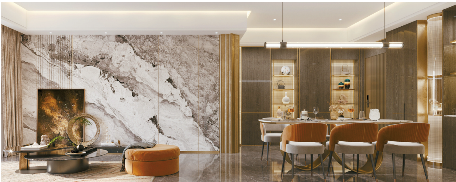
■126平方米户型客餐厅效果图。

潮涌湾区,白鹅潭江水萦绕,在承载千年底蕴中汲取城市向上的力量。在此深耕20多年的新世界中国,又一次用5.0均衡标杆作品,将生活智慧与生活情景完美交融,与城市共同构建有温度有态度的馥雅生活。