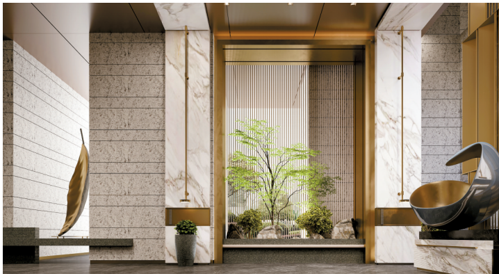
■新世界·天馥入户大堂效果图。