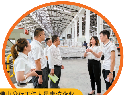
■农行佛山分行工作人员走访企业,了解企业生产经营情况和金融需求。

定位为“TOP10房企的品质标杆”,绿城以“最懂客户”“最懂产品”为两大战略支点,坚持“以客户为中心的产品主义”,持续为更多人造好房子,收获市场和行业的认可。