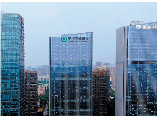
■农行佛山分行新址外景。