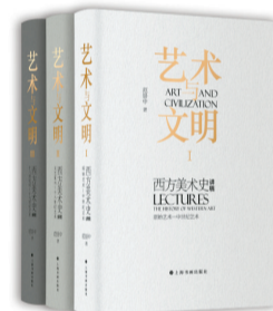
■范景中《艺术与文明》“三部曲”,上海书画出版社