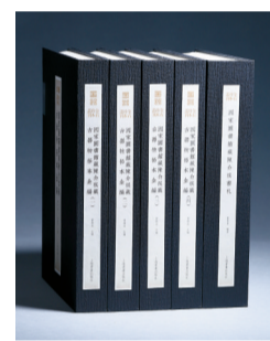
■《国家图书馆藏陈介祺藏古器物拓本全编(全四册)》及《国家图书馆藏陈介祺书札》,上海书画出版社,2024年1月第1版

开始启动对岭南古籍、文献资源的摸底工作,以全面、系统且有层次、有梯度地挖掘岭南古籍文献资源;加强与岭南地区各个领域的古籍文献工作者、研究者的联系,推动整理、研究、出版工作一体化;提前布局,做好年度选题以及中长期选题的规划;做好国家、省、市各级的重点项目、基金项目的申报;服务大局,配合做好全省古籍规划工作。