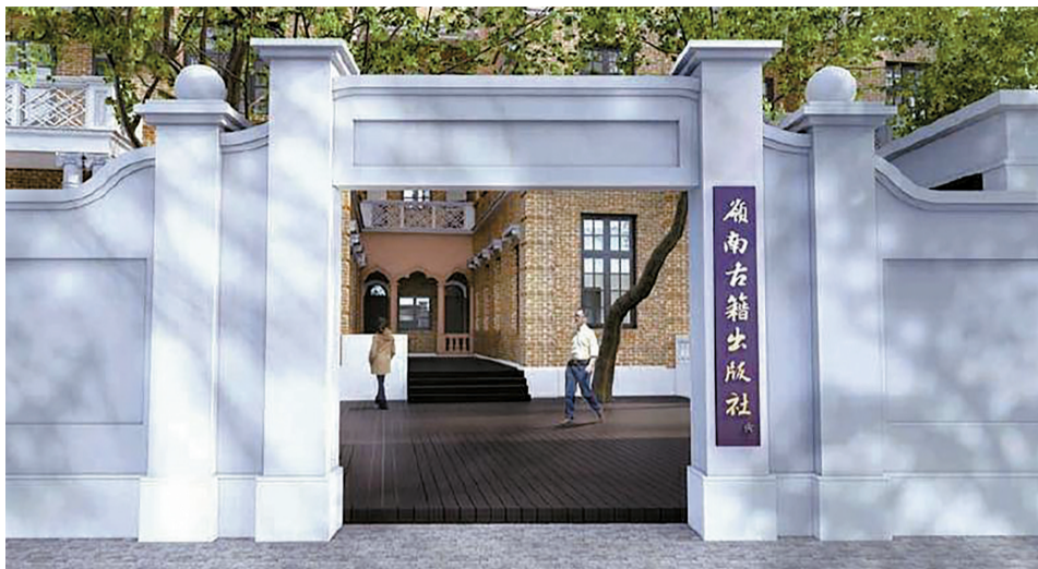
■岭南古籍出版社效果图。 受访方提供