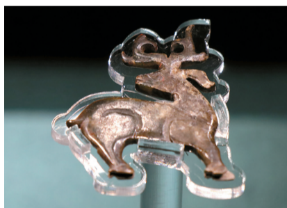
■西周 片雕回首玉鹿