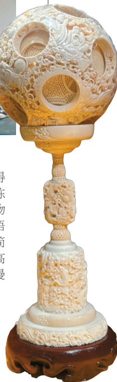
■巧夺天工·古象牙球