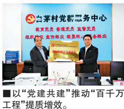
■以“党建共建”推动“百千万工程”提质增效。