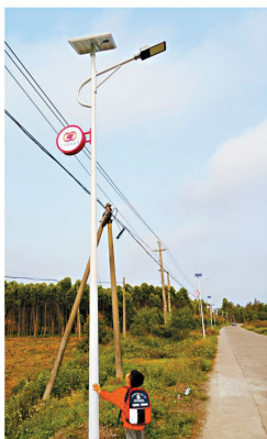
■实施乡村道路亮化工程,用绿色能源照亮“幸福路”。

莫道春来早,更有早行人。御风而行,乘势而上,广东风电公司将坚持党建引领,秉承“厚德善能 益邦惠民”的企业使命,在新能源项目大开发上持续发力,推动“双百行动”和能源发展双向奔赴,推进“千企帮千镇、万企兴万村”提质升级,为助力“百千万工程”提速、乡村振兴贡献能源国企力量与智慧。