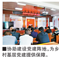
■协助建设党建阵地,为乡村基层党建提供保障。