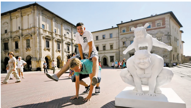
许鸿飞作品在海外与观众互动融洽。

近年来,随着对外交流日益频繁,文艺精品“走出去”的步伐也逐渐覆盖越来越多的国家,中国文化逐渐成为世界所关注。但应当清醒地认识到,文艺精品“走出去”也面临诸多困难和问题,如国际认可度不足、经费有限、传播渠道未能形成合力,难以产生持续的影响力等,亟需加强顶层设计和统筹协调,推动文艺精品“走出去”提质增效,提升国家文化软实力。