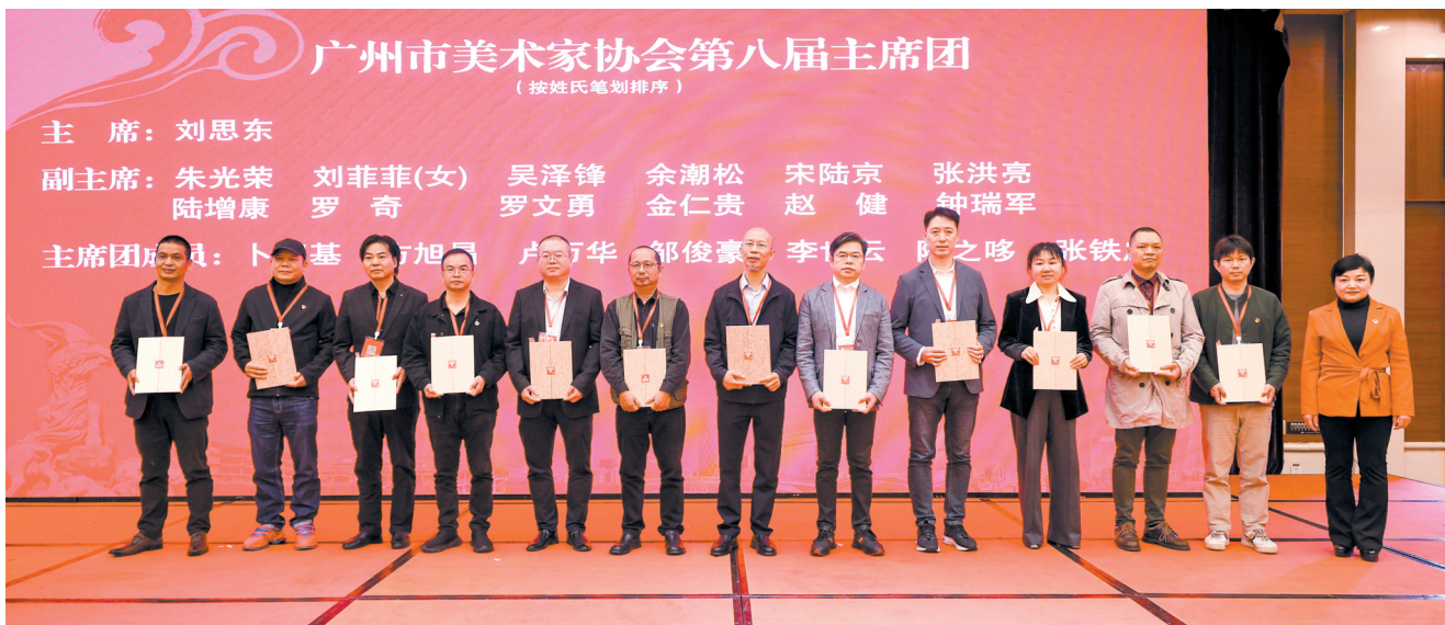
■广州市美术家协会第八届主席团。

3月16日上午,广州市美术家协会第八次会员代表大会在广州市珠江宾馆举行,选举产生了新一届主席团和理事会,圆满完成协会换届工作。中共广州市委宣传部常务副部长曾伟玉,广州市文联党组成员、专职副主席胡子英,广州市文联党组成员、专职副主席吴碧,广州市文联一级调研员(市管干部)陈启银,广东省美术家协会专职副主席叶正华,中共广州市委宣传部文艺处(电影处)处长、一级调研员皮健,老艺术家代表陈金章、陈永锵、方楚雄、李醒韬、周国城、苏小华、黎日晷等领导嘉宾出席会议。