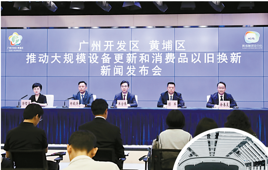
■4月15日,广州开发区、黄埔区“推动大规模设备更新和消费品以旧换新”新闻发布会现场。

据介绍,在促进汽车更新消费方面,2023年黄埔区购车补贴活动共发放补贴金额约7000万元,惠及消费者超2万人,实现汽车销售额约36亿元。目前,全区已有36家汽车销售企业陆续推出以旧换新活动,最高可享受每台车3万元的置换补贴。