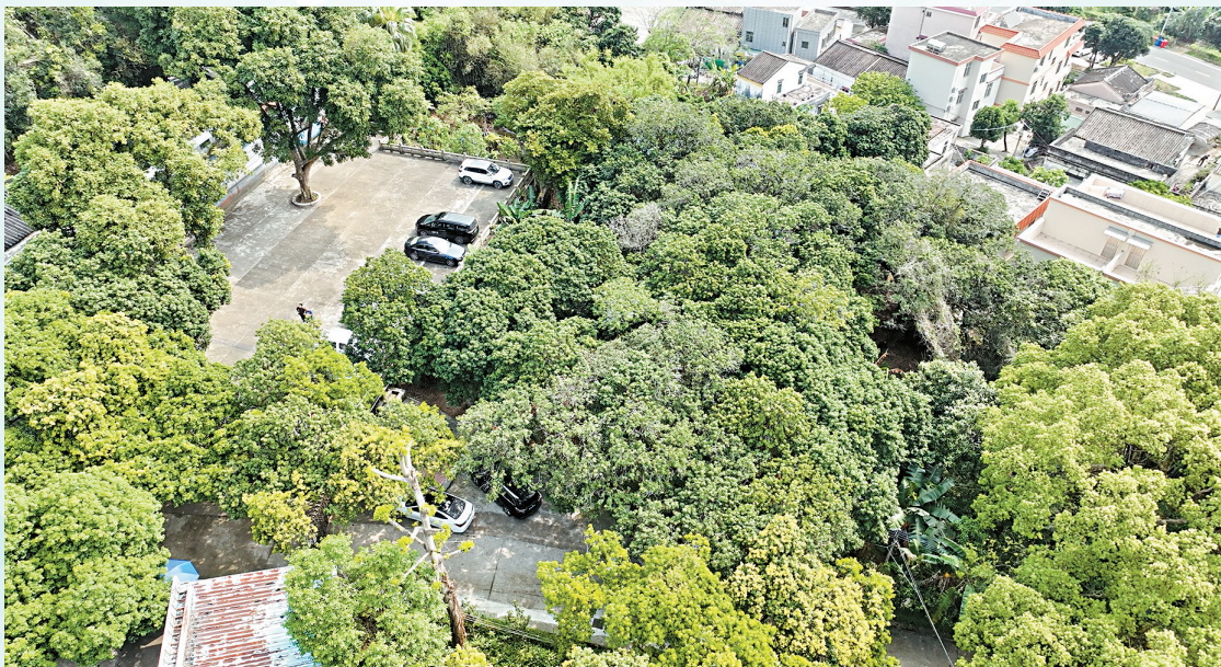
■位于中山槟榔山村的荔枝古树群,平均树龄超过140年。

在著名侨乡——中山五桂山街道的槟榔山村,有一片由33棵古荔枝树共同组成的荔枝群,这是中山市目前存在的两个荔枝古树群之一。这些荔枝,树龄普遍超过140年。100多年的光阴里,它们渐渐长成了参天巨木,密密的树冠将天空遮盖得严严实实。