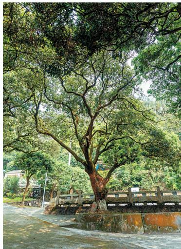
■荔枝古树已长到十几米高,人在其中,仿佛误入“绿野仙踪”。