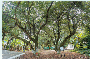
■一百多年的光阴里,荔枝树渐渐长成了参天巨木。

此后,林业部门将这些古荔列为重点保护古树,拨出专款指派科技人员加强技术管理,对这些古荔进行更新复壮,采取科学技术进行保护栽培和精心管理。许多古荔开始抽发新枝、开花,结出甜甜的果实。平均每棵荔枝树,每年可以产几百斤荔枝。