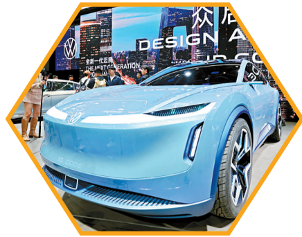
▲大众新发布的车型。

今已成功举办了16届。此前因疫情影响,2022北京车展未能如期举行,因此本届车展距上一次举办已过4年。