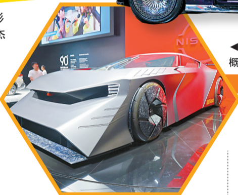
◀日产Hyper Force纯电动概念车完成中国首秀。

除各大汽车品牌外,芯片、电池等产业链企业也在车展上大秀“肌肉”。宁德时代、华为、华为数字能源、科大讯飞、亿纬锂能、大疆车载、欣旺达等零部件及高科技公司均有参展,且参展展品涵盖传统汽车零部件、总成、系统,以及发展