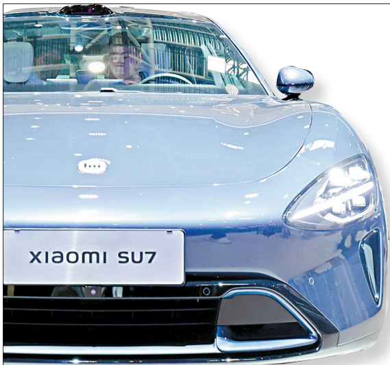
▲观众体验小米汽车。

■车展现场人头攒动,国内外各大汽车厂商参展热情高涨,纷纷携旗下重磅车型或最新前沿技术亮相现场。