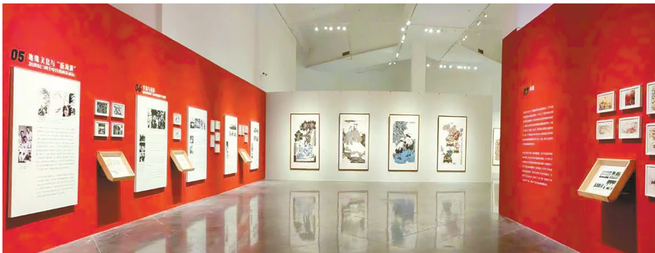
■“从可园出发——中国花鸟画展”现场

在“从可园出发之没骨新风——没骨法新探作品展”学术交流会上,嘉宾们围绕“没骨法新探”的主题展开探讨,各抒己见,关注没骨一体花鸟画在当下的探索,探讨其背后“写意精神”的古今转换,以及传统文心、传统文脉在当代的价值延伸和重构。展览结束后,集合了展览内容及学术成果的《从可园出发:没骨新风——没骨法新探作品集》由岭南美术出版社出版发行。