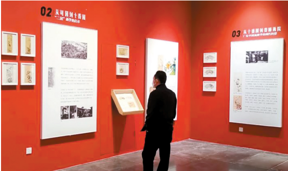
■“从可园出发——中国花鸟画作品展”现场