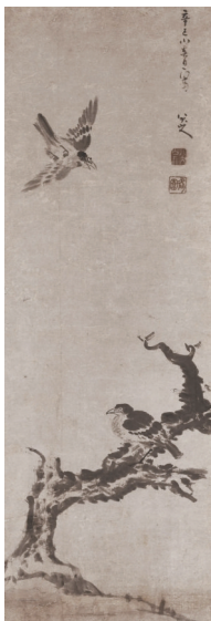
■八大山人《枯木双禽》,127.5 x 43.2 cm,图片来自佳士得

八大山人辛巳年(1701)作品存世知见不多,《枯木双禽》无疑是其晚年精品力作。因此自1940年代开始,这件作品一直是学术研究和出版的重要对象。八大山人运用疏简道劲的线条,浓淡枯湿的墨气,透过一树双鸟简单题材,在前朝王孙心态与禅宗思想的相互交融下,反映出尘世的观照与冷寂心境,细腻的情物有机地体现在他笔下的花鸟画里。