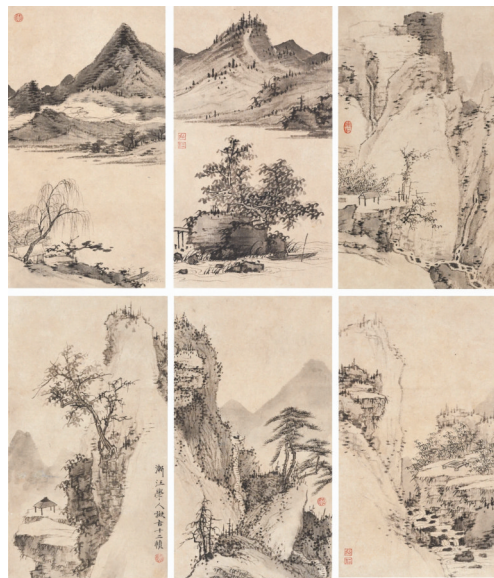
■弘仁《拟古山水》局部,水墨纸本,册页十二开,每开:27.6 x 16 cm

弘仁诗书皆长,更擅画山水,借传统之气以独创一格,最佳展现其道劲笔力下悠然忘我之情。本作《拟古山水》册页十二开,绘尽山川林木的各个样貌,以崇山峻岭之壮阔舒愤解忧,以苍劲整洁、恬静淡雅的笔触道尽其豁达大度之悟。