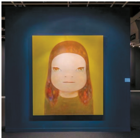
■奈良美智《我愿今夜一睹璀璨光辉》,图片来自苏富比

季涛分析称,分别从两大板块的角度看,包括书画和古董瓷器在内的中国传统艺术品,这次苏富比春拍成交了6.96亿港元,占比总成交额35.29%;而2023秋拍和春拍该板块的占比分别为