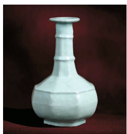
■宋或较晚,官釉八方弦纹盘口瓶,高22厘米

场中的最高成交价为1497万港元,是一件‘战国晚期的青黄玉卷龙扭丝纹珮’。这件拍品的拍前低估价只有40万港元。显然,东西好,估价低,是成交好的不二法宝。”