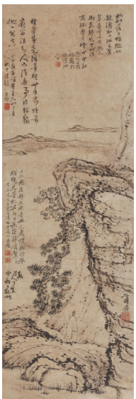
■石涛(传)《岩松高士图》,73.1 x 24.2 cm,图片来自佳士得