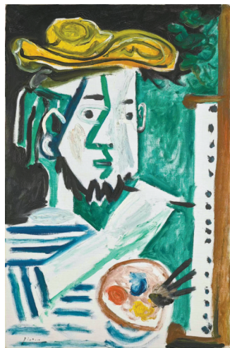
■毕加索《画家》,“此作是毕加索晚年的自传式钜献,多年来神隐私人收藏而从未释出于拍场”,图片来自苏富比

“2023年秋拍及之前,苏富比总是将现代艺术夜场与当代艺术夜场分开举行,其当代艺术夜场的成交额常常高于现代艺术夜场。比如,苏富比2023秋拍的‘当代艺术晚间拍卖’专场上拍了26件拍品,拍前无撤拍,总成交额3.53亿港元,而其‘现代艺术晚间拍卖’的总成交