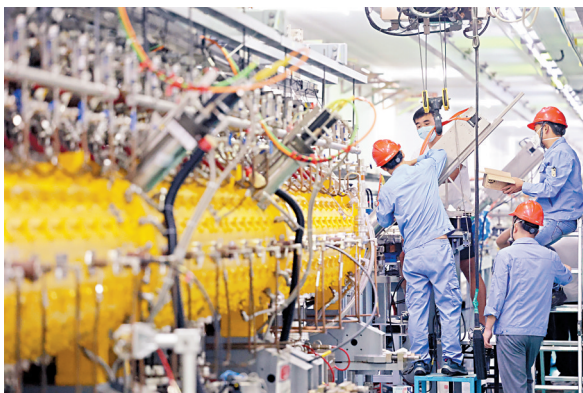
■2022年8月11日,位于东莞松山湖的中国散裂中子源基地,工作人员正在进行设备检测。