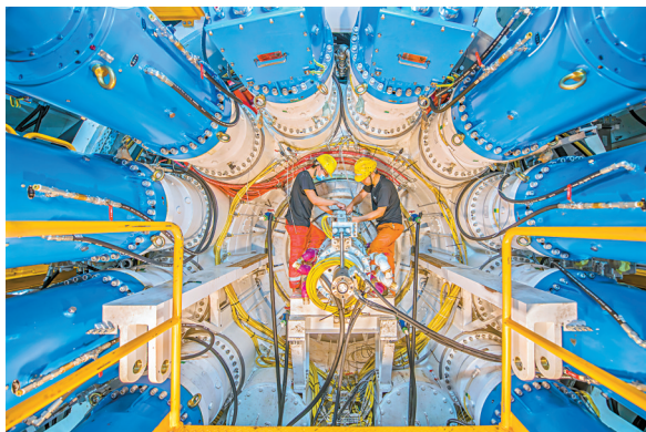
■2022年5月21日,广东省佛山市顺德区中铁华隧联合重型装备有限公司生产车间,工人在装配主驱动关键部件。