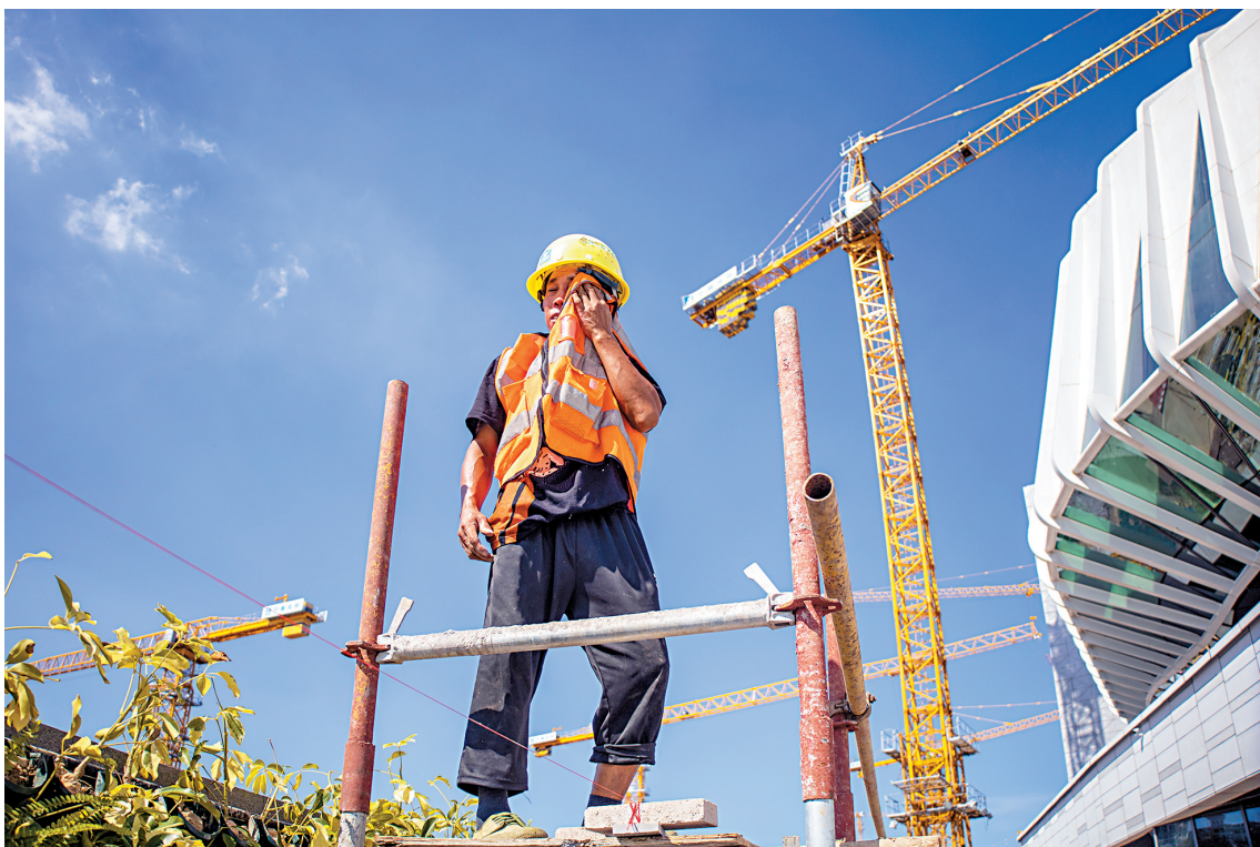
■2022年7月13日,广州知识城产业聚集服务中心项目工地上,工人顶着烈日劳作。项目建成后将成为知识城北部片区的交通枢纽中心、科创产业集聚中心和高端人才集聚中心。

一个个大项目拔地而起 广州白云国际机场三期扩建工程…… 江门中微子实验室、 中国散裂中子源、 深中通道、