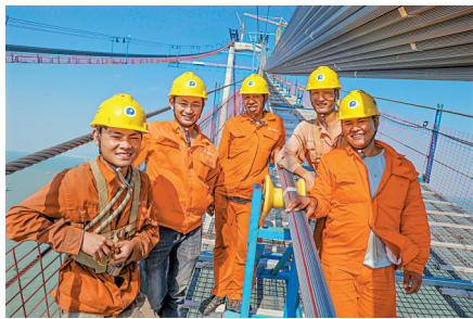
■2022年9月3日,来自四川凉山的彝族年轻工人们在深中通道伶仃洋大桥主塔上合影留念,为能参与世界级超级工程建设倍感自豪。