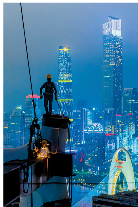
■2023年6月4日,广州市海珠区琶洲人工智能与数字经济试验区一座座数字经济的龙头企业大楼拔地而起,建设现场如火如荼,对岸是广州新中轴线五彩缤纷的珠江新城,夜幕下高空建设者,用汗水换来城市高楼耸立。