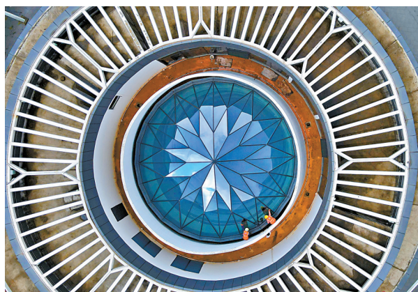
■2023年6月9日,广州知识城广场项目二期工程通过竣工验收,工人正在对楼顶进行清洁打扫。