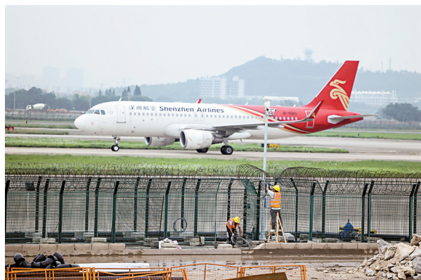
■2023年5月10日,广州白云国际机场三期扩建工程施工现场,工人正在进行护栏的围蔽搭建。