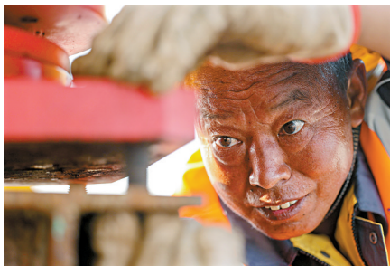
■2022年9月14日,珠海市高栏港区,工人正参与操作千吨级架桥机进行高栏港大桥东引桥节段架设。