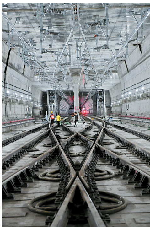
■2021年9月20日,中铁十一局的工人在18号线番禺广场站咽喉区检查道岔调试情况。