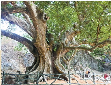
■林中古树老而不衰,至今依然年年开花结果。

据介绍,结合古树资源,石寨村引入历历万乡艺术民宿项目,总规划面积约50亩,计划总投资2500万元,以质朴自然的古树村落为载体,开发网红打卡点,打造生态营地。包括绿化采摘果园、亲子家庭种植园、文旅民宿度假园、露营地、摄影爱好者作品展示区等区域,以点带面促进当地旅游消费和群众增收。目前,其阶段性项目已开始试营业。