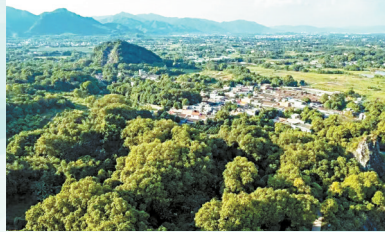
■古村被绿树环拥,世代相爱,相依相存。

保护后的绿色开发为村里带来更大的经济效益,石寨村古树群,正变成村民们的“致富林”。保护树木如今已蔚然成风,很多村民自发加入护树志愿团队。“沙美村有位65岁的老人,对种树护树很有心得,经常去林子里观察古树的生长情况,发现病虫害马上上报,还经常提出保护意见。”胡炳坚坚定道,前人栽树后人乘凉,他们这些“后人”也终将成为“前人”。“我们对古树的爱护,何尝不是为了我们的子孙后代?”