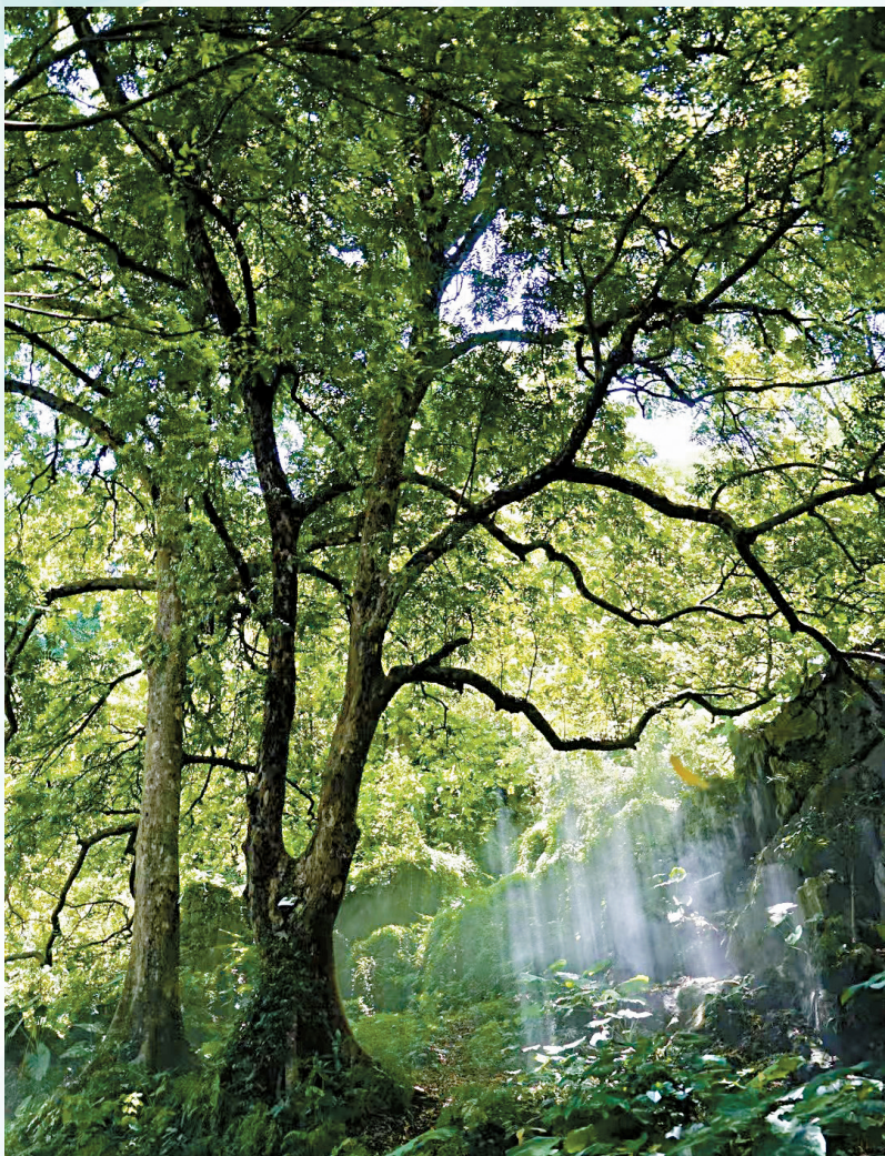
■阳光透过密密匝匝的枝叶洒入古树群深处。

而今,古村石寨藉其险峻石山,厚重石墙,葱郁古树和端肃古祠绘就一幅秀美的乡村画卷。长卷之内,平均树龄过百岁的人面子古树群,2023年入选广东省“十大最美古树群”,不仅滋养一方水土,更成为绿美肇庆生态建设图中一道靓丽的风景线。