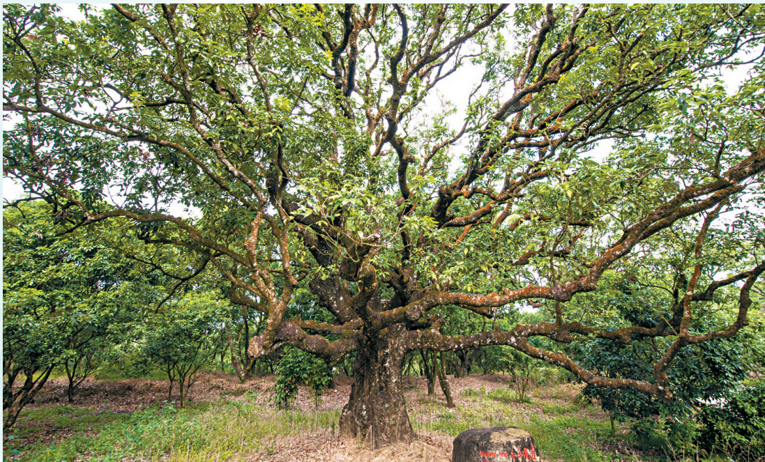
■“千手观音”是贡园古树群内最具特色的古树之一,树龄超过600年。

招展时光之巅,笑看风云变幻。位于广东茂名高州根子镇柏桥村委会岭腰自然村的贡园,占地面积80余亩,距今已有2000多年的历史,是国内面积最大、历史最悠久、保存最完好、老荔枝树最多、品种最齐全的古荔园。“一骑红尘妃子笑,无人知是荔枝来。”相传唐代开元年间,高力士进贡给杨贵妃品尝的荔枝便出自此地,著名的白糖罂优质荔枝品种,亦由此发源并远销四海。因此贡园成为名副其实的“荔枝博物馆”。