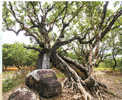
■当地人依据每棵树的形态,赋予了贡园古荔专属昵称。此古荔名为“虚怀若谷”。

为深挖高州市荔乡文化,塑造世界荔乡旅游典范,近年有多个农旅项目相继落户根子镇,而高州市政府也积极推动大唐荔乡核心区乡村振兴项目——高州荔枝文化和产业发展示范带项目建设。据了解,该项目规划设计面积约415亩,内容包括贡园古荔枝文化提升、红荔文化教育基地改造、贡园-红荔阁沿线农房管控风貌改造。计划以岭南风情及大唐文化为依托,荔枝产业为特色,打造“粤韵唐风”主题特色,弘扬贡园历史文化,促进荔枝产业发展。滨河美镇、森林小镇、产业强镇和魅力荔乡……根子镇的未来图景呼之欲出。