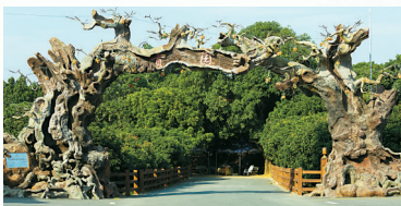
■贡园入口处的树干造型拱门。

“千手观音”是贡园古树群内最具特色的古树之一,树龄超过600年。在它斑驳的主干上,分枝繁茂,每一处枝丫都修长,且稠密又均匀地生长在分叉处,像极观音身上长出的千百只手掌。正值荔枝挂果季,“千手观音”红绿相间,仿如孔雀开屏,绝美风姿令人叹为观止。