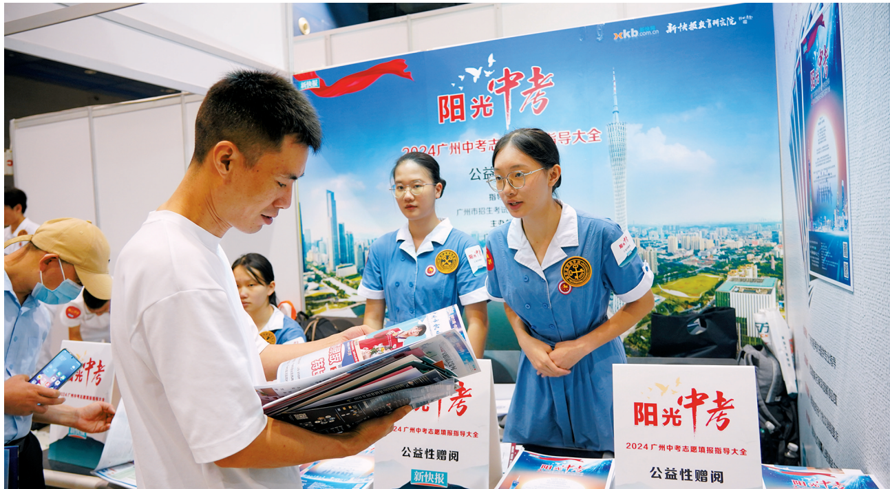
■考生家长翻阅《阳光中考》特刊。