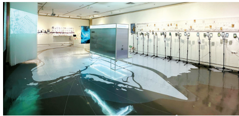
■“看见海丝路——重拾文化遗产”毕设展览现场。