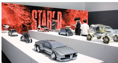
■2024年广美本科生毕业展第一期现场。