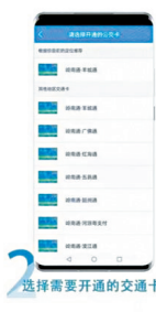
2 选择需要开通的交通卡