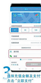
3 选择充值金额及支付方式后 点击“立即支付”