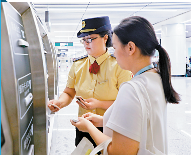
■工作人员指导旅客买票。