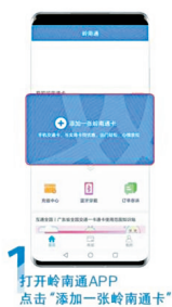
1 打开岭南通APP 点击“添加一张岭南通卡”