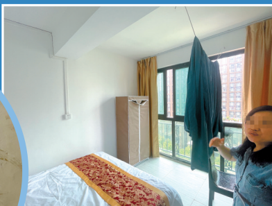
■ 金莱阁11层某复式公寓内，房东向记者介绍其中最好的一间房。