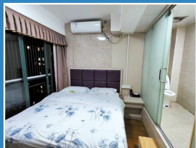
■ 酒店订房APP上客人拍的丽晶华庭某旅馆房间图片。