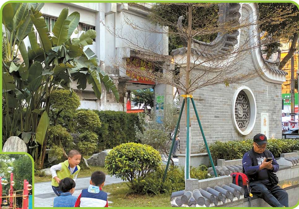
▲小孩放学后,在康王口袋公园里玩耍。

记者留意到,云憩里公园的一大特色便是公园里摆放着几辆智能动感单车,萧岗海绵探索乐园也是如此。采访当天,记者见到几个小朋友在单车上“比拼”。附近的居民告诉记者,公园周边小区、幼儿园、小学、中学众多,每天都有许多家长前来遛娃,不过,近期人流量略有减少,一方面是因为近来天气炎热且晴雨多变,而公园内游乐设施大多为露天装置,需要找准时机来此游玩,或者干脆选择其他室内场地;另一方面则是公园内多设置雨水花园、植草沟等海绵城市元素,植被众