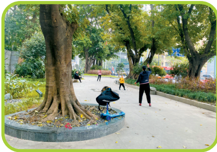
▲鲁迅纪念公园里,市民在打羽毛球。