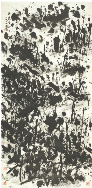
■崔振宽 2024年作品《计黑当白之一》。

的理解不同,而我认为大写意代表的是一种文化精神和一种艺术传统,并不认为只有类似于齐白石那样的画才算大写意。