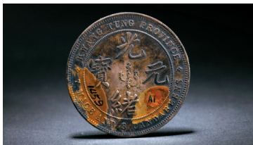
■广东省造光绪元宝每百枚换一圆铜币

本卷收录了39件馆藏钱币,或具有时代代表性,或为珍稀钱币。既有先秦时期的安阳之法化刀币、甘丹尖足布币、宋大观通宝铜钱、金贞祐通宝铜钱、元至元通行宝钞贰贯,也有见证了南汉