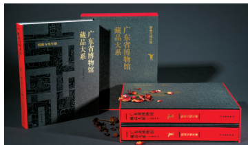
■《广东省博物馆藏品大系·铜器与钱币卷》

国治下广东社会面貌的乾亨重宝铅钱。本卷遴选了较多机制铜元和银币,突出广东省博物馆传世钱币藏品的强项,如广东省造光绪元宝每百枚换一圆铜币是我国最早铸造和使用的机制铜元。(潘玮倩 粤博宣)