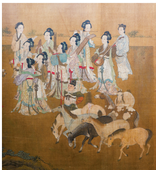
■王振鹏(传)《孔子圣迹图》(局部)。

国治下广东社会面貌的乾亨重宝铅钱。本卷遴选了较多机制铜元和银币,突出广东省博物馆传世钱币藏品的强项,如广东省造光绪元宝每百枚换一圆铜币是我国最早铸造和使用的机制铜元。(潘玮倩 粤博宣)